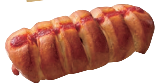
ウイナロールパン