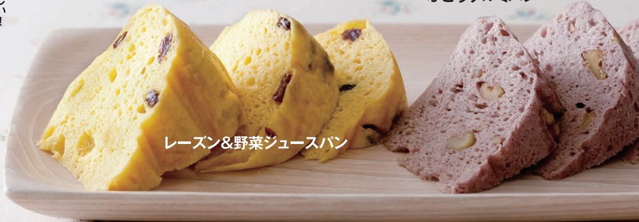
レーズン&野菜ジュースパン